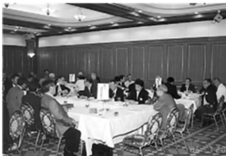
各委員会打ち合わせ風景 委員長より本年度の活動方針及び抱負を発表していただきました。メンバー皆様で協力し目標の達成、活力ある沼津ライオンズクラブにしていきたいと思います。