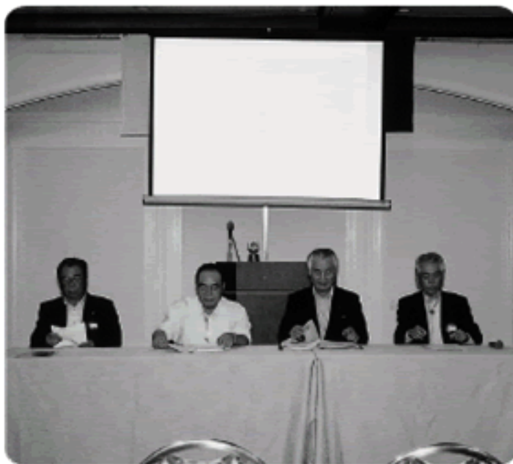
4人のライオンによるパネルディスカッション