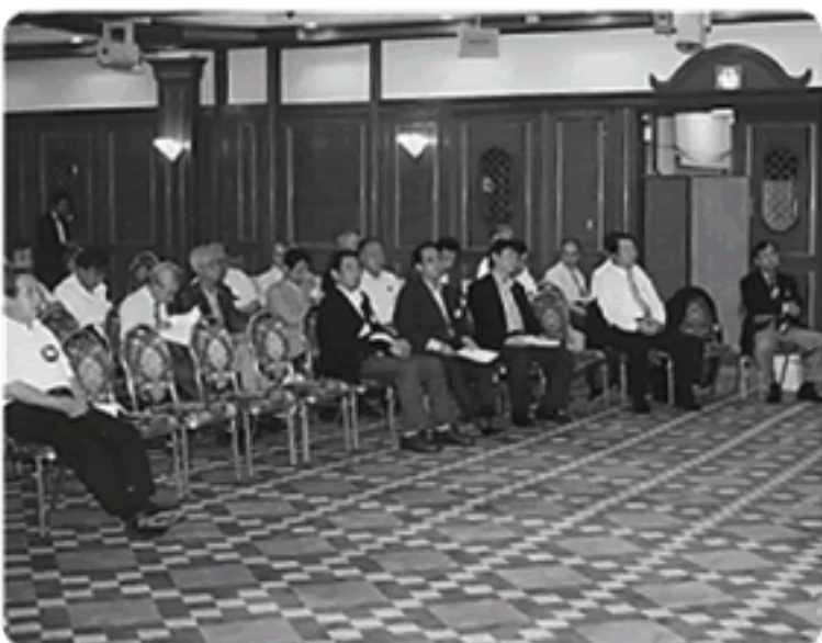
イスの配置も工夫してます

最近クラブの決定事項は、理事会のようになっているが、例会が主導する原点に戻る必要があるのではないかと。クラブの活性化のため、スポンサーは新入会員の面倒をしっかり見て、新しく入った会員には、早く役をやってもらい、クラブのいろいろな事を憶えて、役を通じて馴染んでいくことが、出席率の向上、クラブの活性化につながると思う。