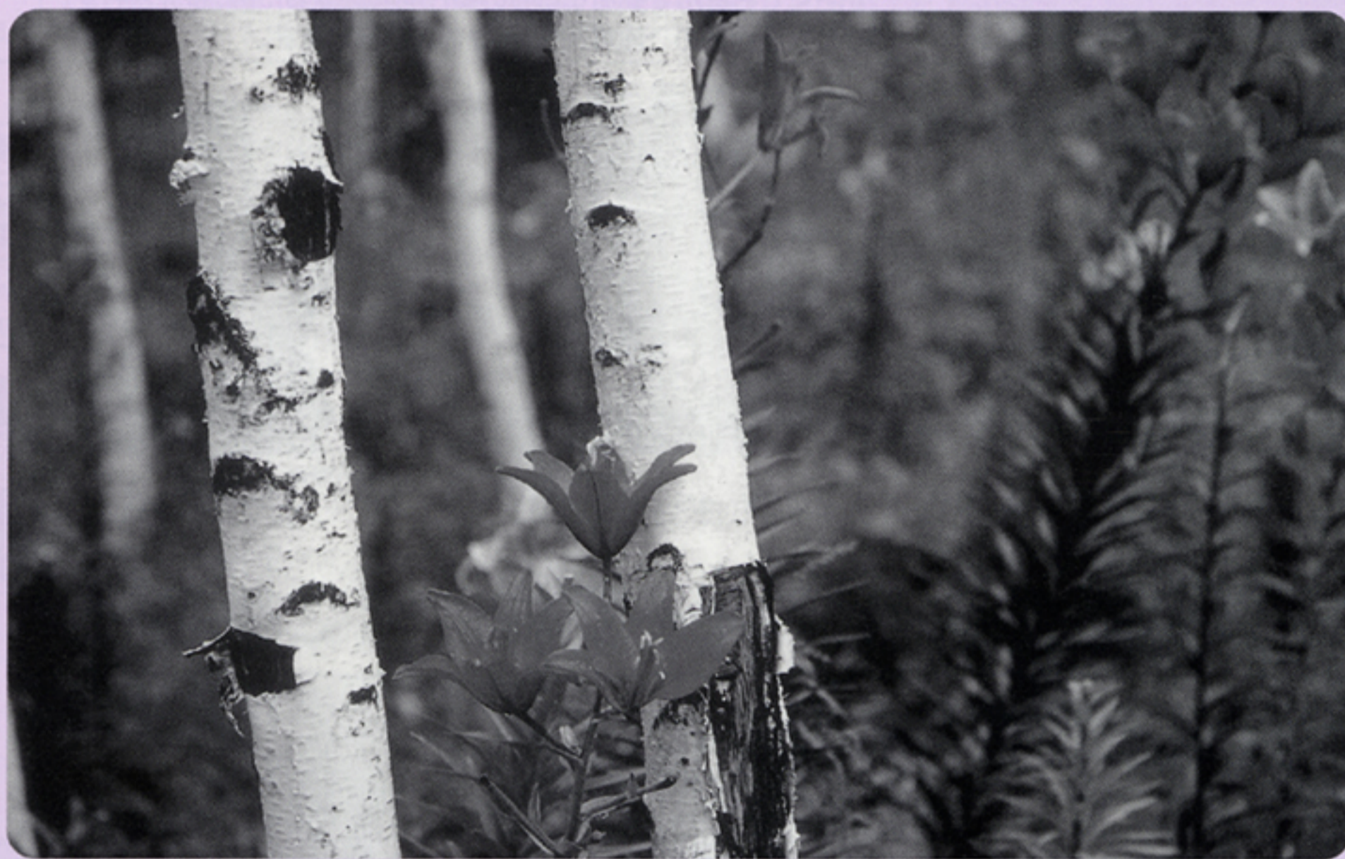
「白樺と高原のユリ」(富士見高原ゆりの里)8月上旬 写真部撮影会 L.土屋榮一