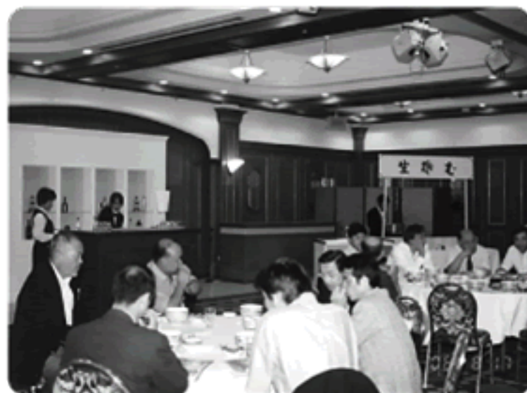
出前方式の食事風景

また植樹は、継続事業として、何年もかけて、計画的に行い、大々的にやっていった方が良いと思います。