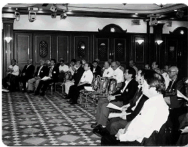
真剣に聞く会員のみなさん