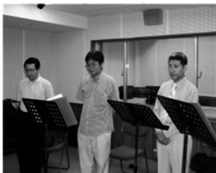
合唱風景テノールパート

例会の最初はまず準備運動から始まります。体をほぐして発声練習。腹式呼吸でフーフーハッハッとしているうちに、だんだんやる気になってきます。初めての曲は最初バラバラで歌っていきながら笑ってしまいがちですが、2度、3度繰り返すうちに不思議と聞ける様になってきます。1回の例会で4曲程度練習します。現在練習しているのは、①ともしび②ラノビア③トロイカ④別れのタンゴ等ですが、レパートリーは20曲以上になっています。発表の場が少ないので、多少欲求不満気味のメンバーも出てきていますが、楽しく歌っています。カラオケばかりではなく、たまには真面目に歌ってみませんか。腹式呼吸で健康にも良く、体力も使いますので、歌った後のビールは最高ですよ。新規入会お待ちしております。