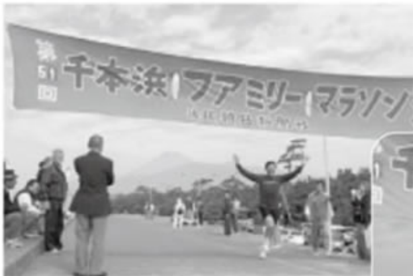
ファミリーマラソン大会