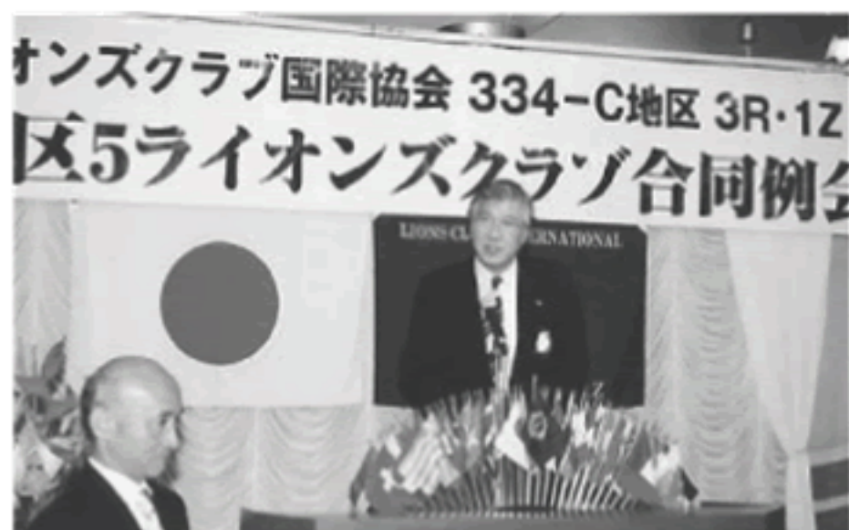
当クラブ 芹澤会長 閉会の挨拶