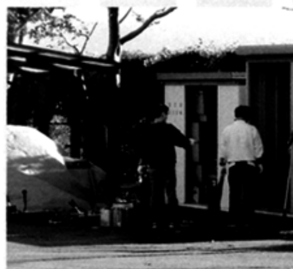
缶つぶし機も以前に寄贈したものです