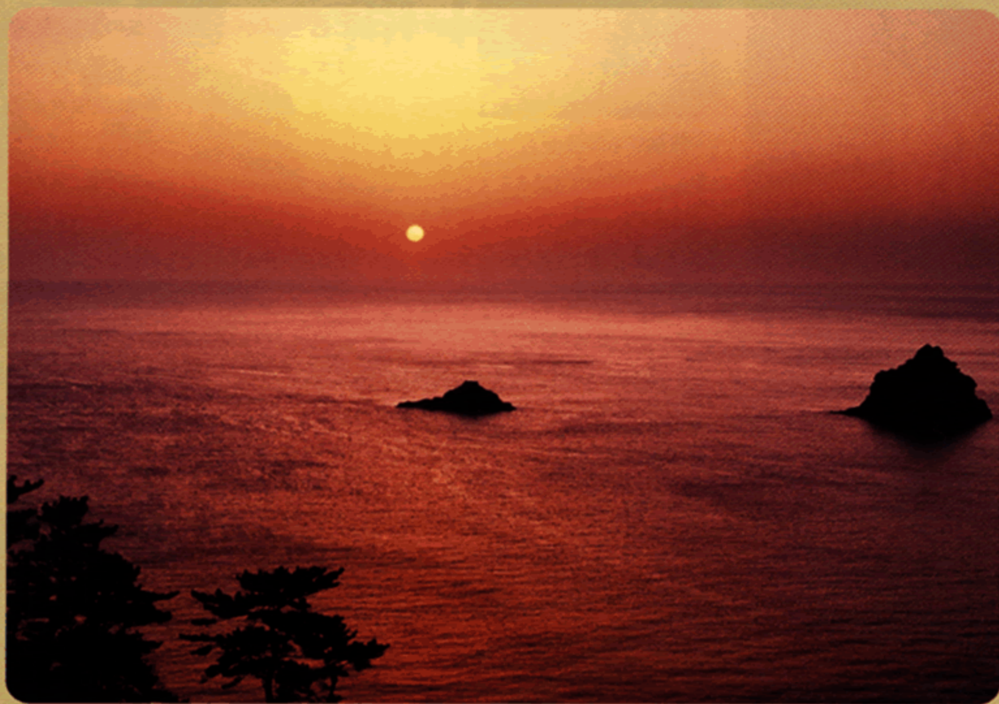
「日の出」 L.渡邊 章