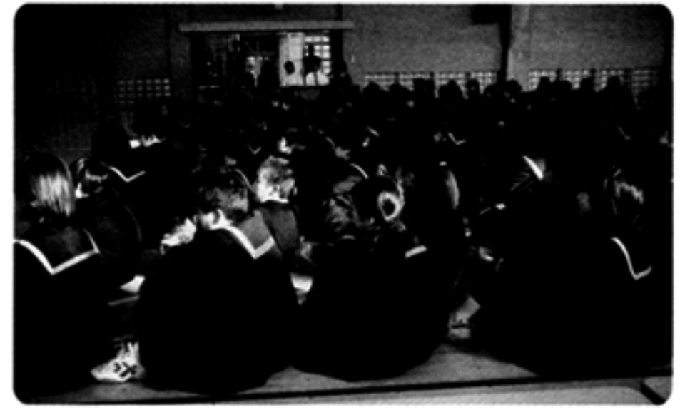
第一中学校において