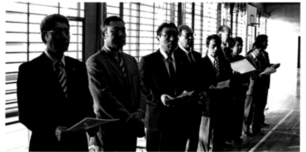
参加したメンバー