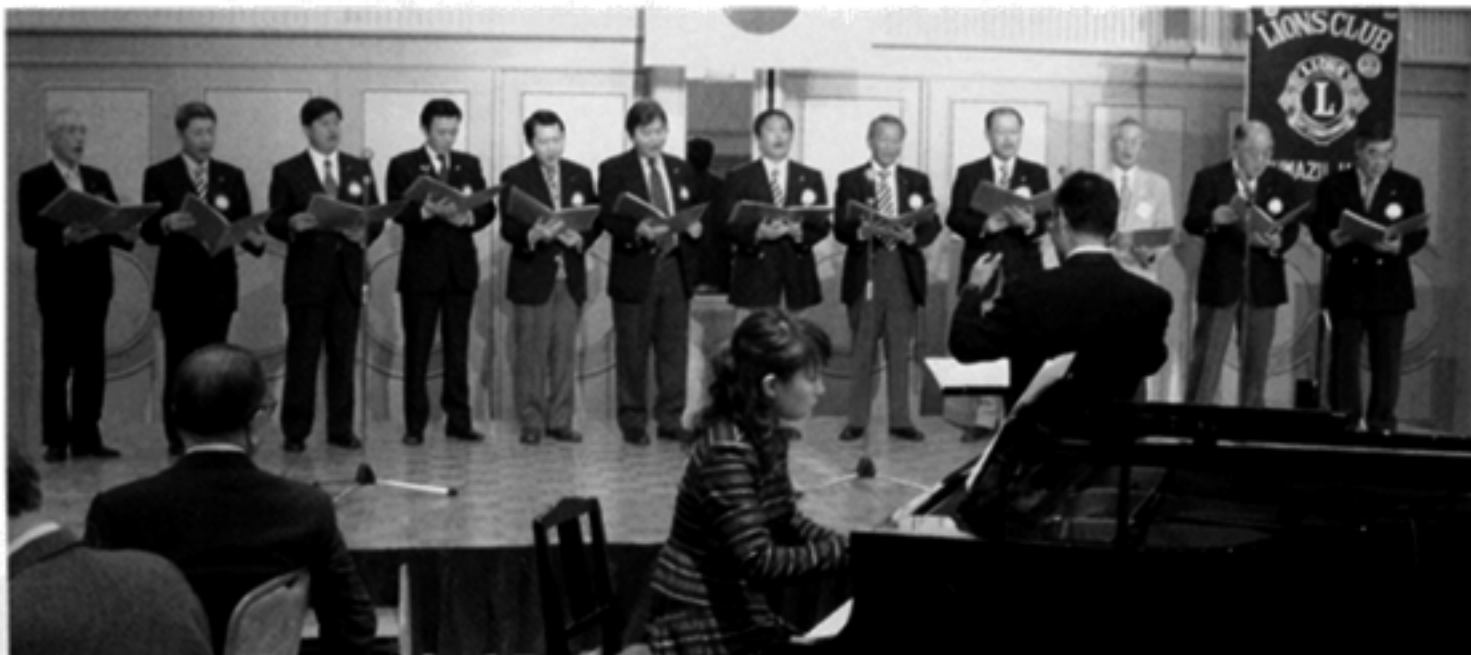
祝宴の部はボーカルエルのコーラスで始まる