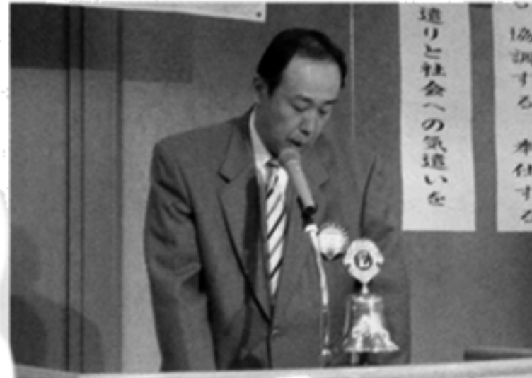
環境保全委員長L.外より地区セミナー報告