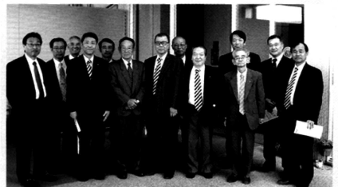
玄関前で記念写真13名