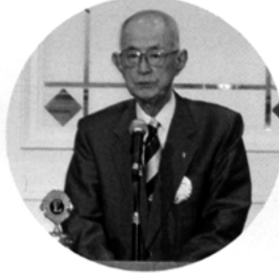
L.勸山 厚生労働大臣感謝状受賞ごあいさつ