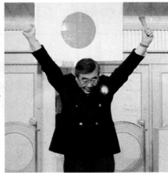
計画大会委員長L.丹澤によるローア