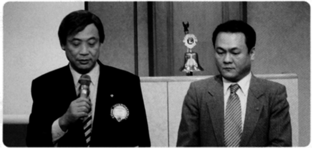
スポンサーL.土屋より紹介