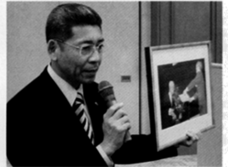
竹村会長からL.勸山へ記念品贈呈