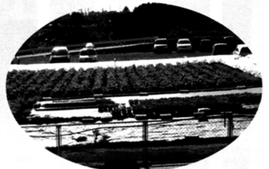
畑では野菜づくり