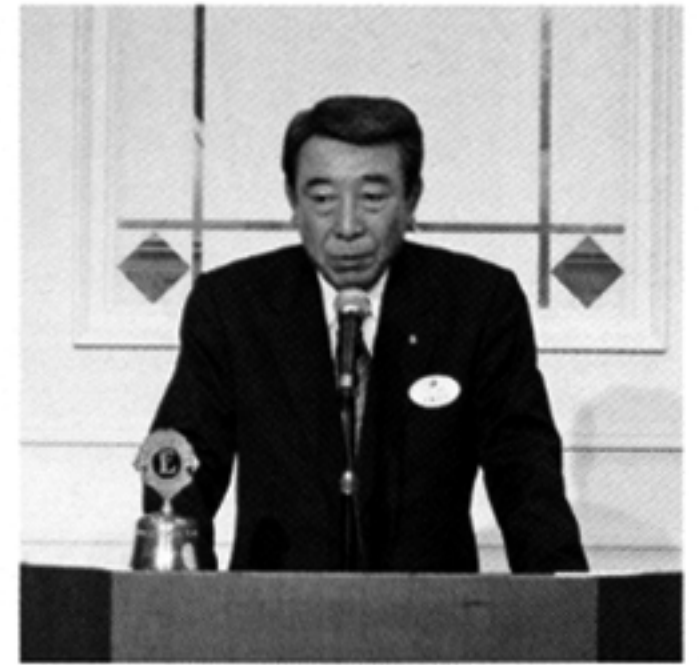
沼津香陵LC L.手島のごあいさつ