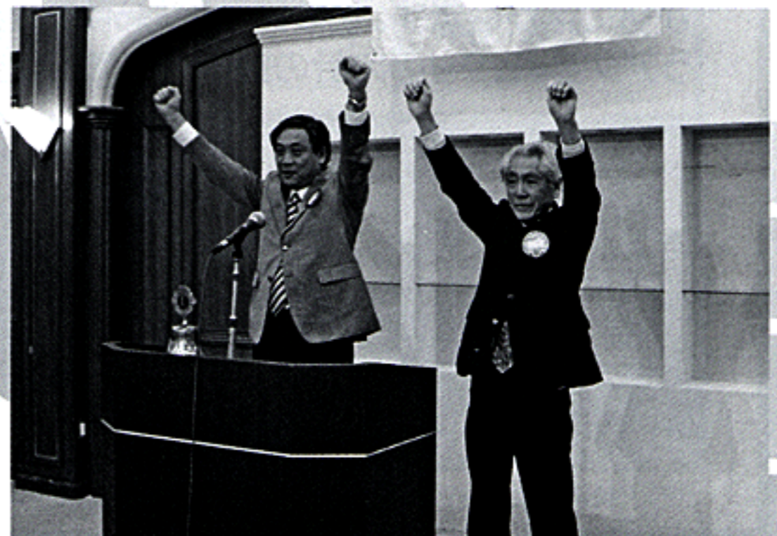
L.土屋・L.横山によるローア