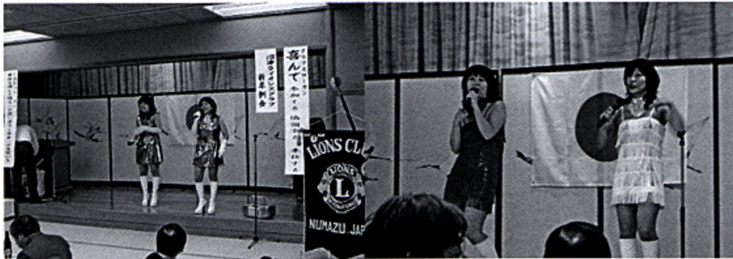
「ネオピンク」ライブ