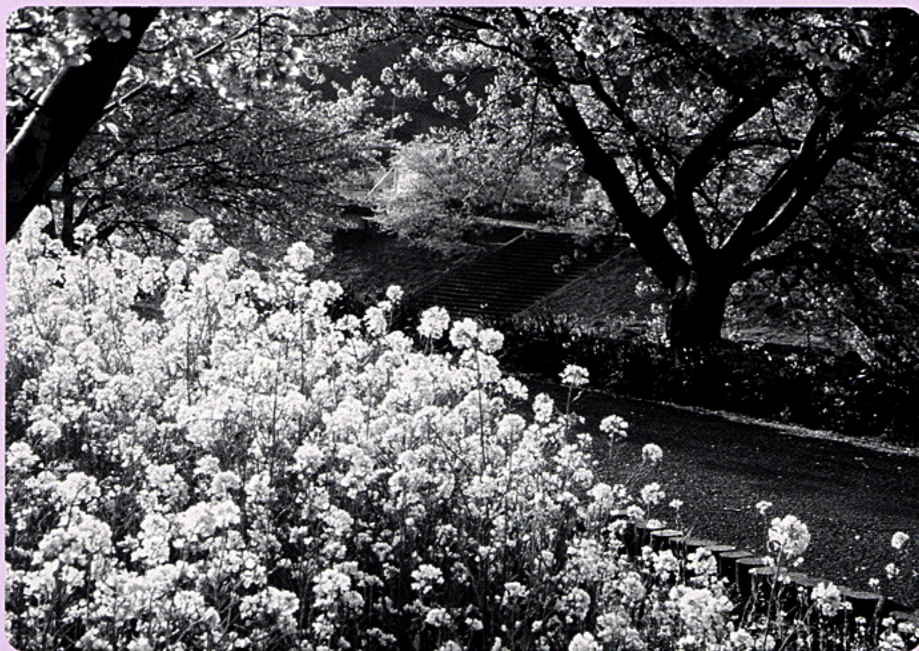
「南伊豆の春」 L.土井 達夫