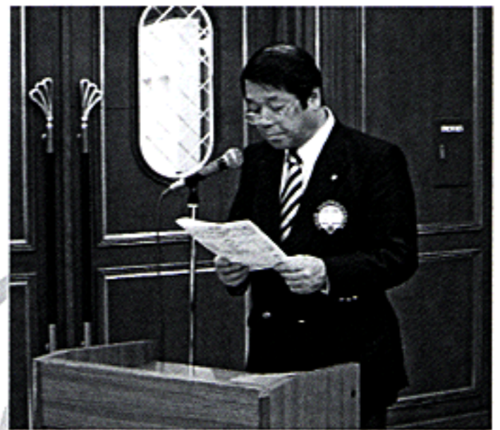
前期決算報告 L.古地