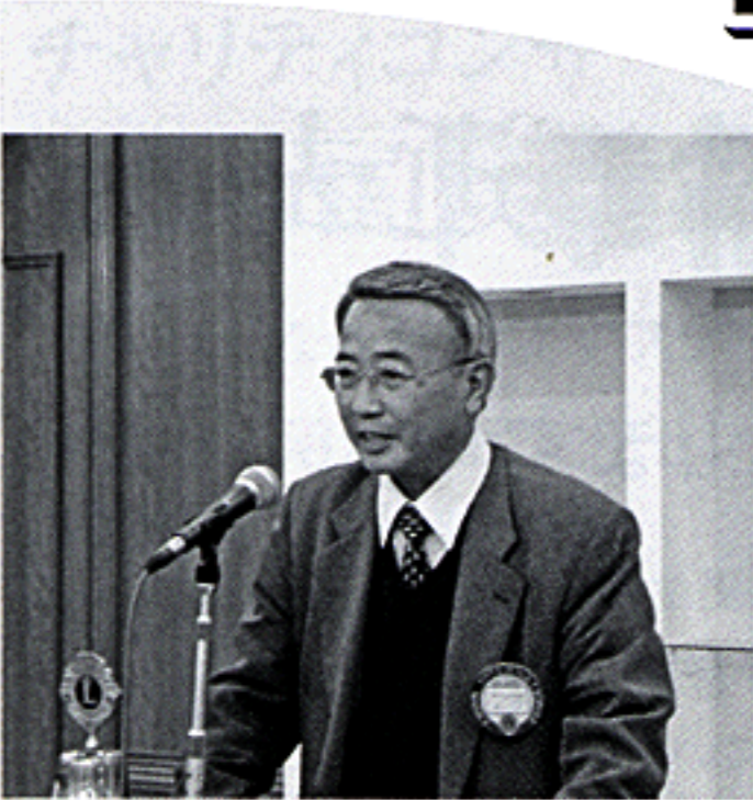
LCIF基金について YEプログラム・LCIF委員長 L.野田