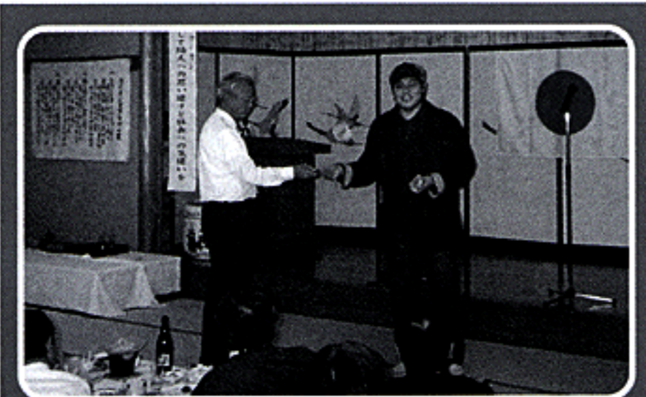
マジシャン「ユウ」のマジックショー