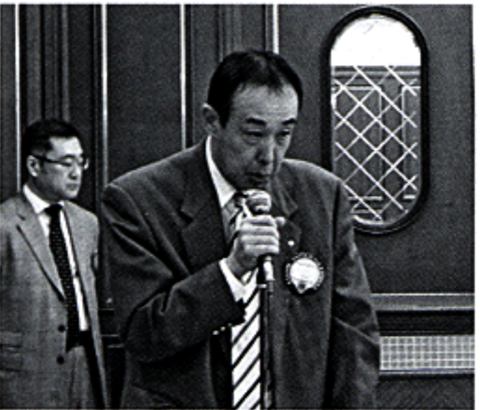
富士山植樹の今後について 環境保全委員長 L.外