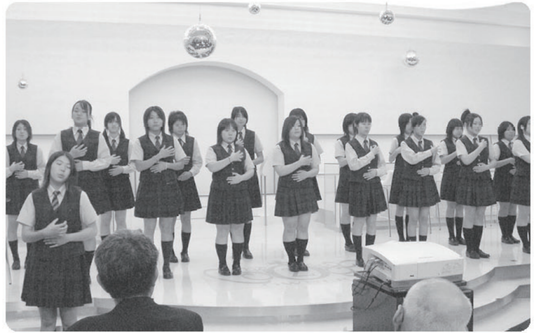
高校生による「手話合唱」