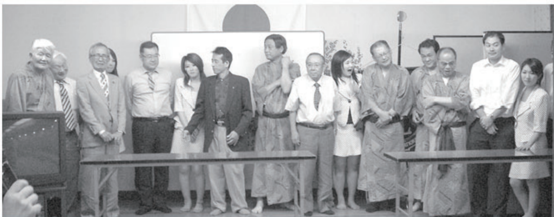
何が始まるのでしょうか?ふだん見せない表情のメンバーです