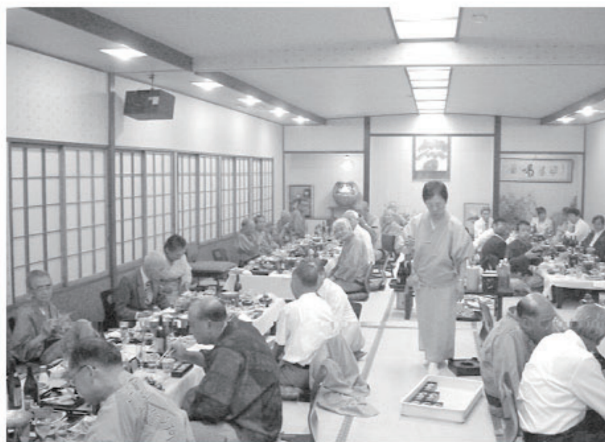
一年間お疲れ様でした