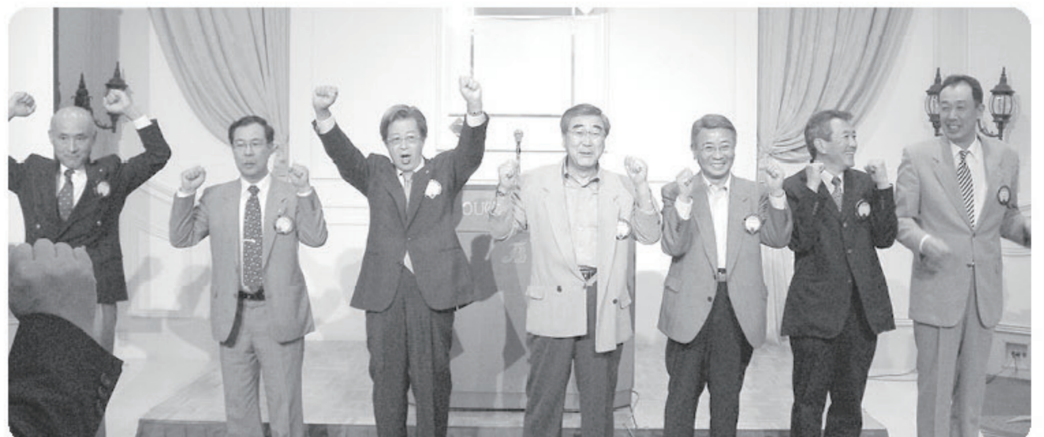
各委員長によるローア