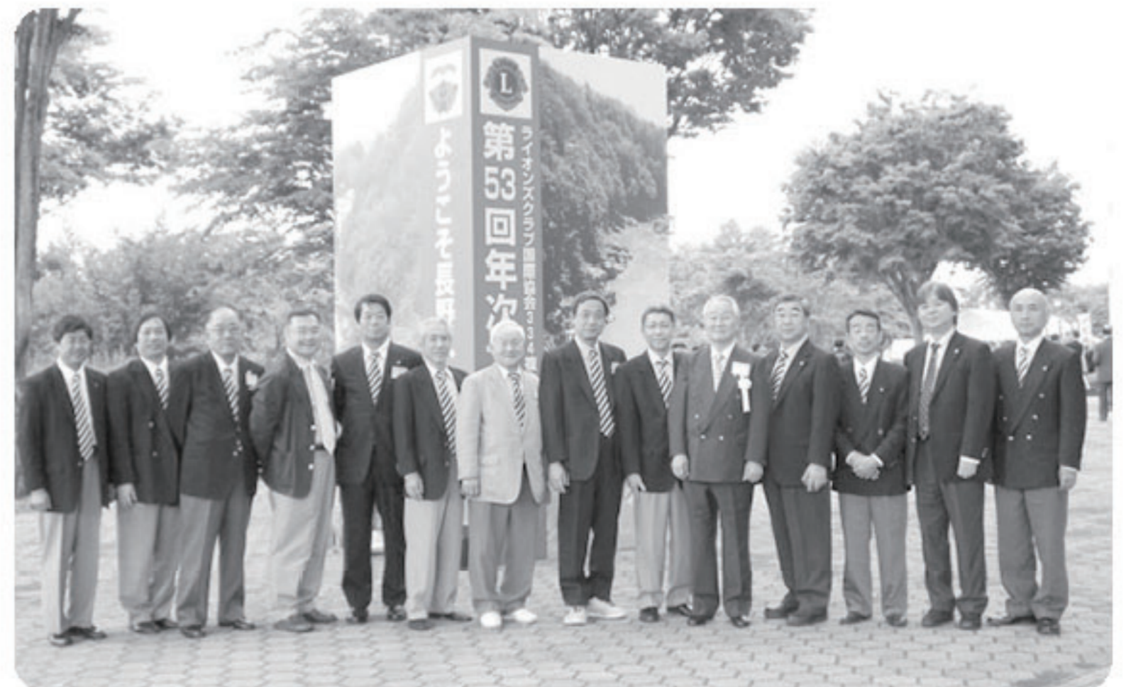
会場前に勢ぞろい