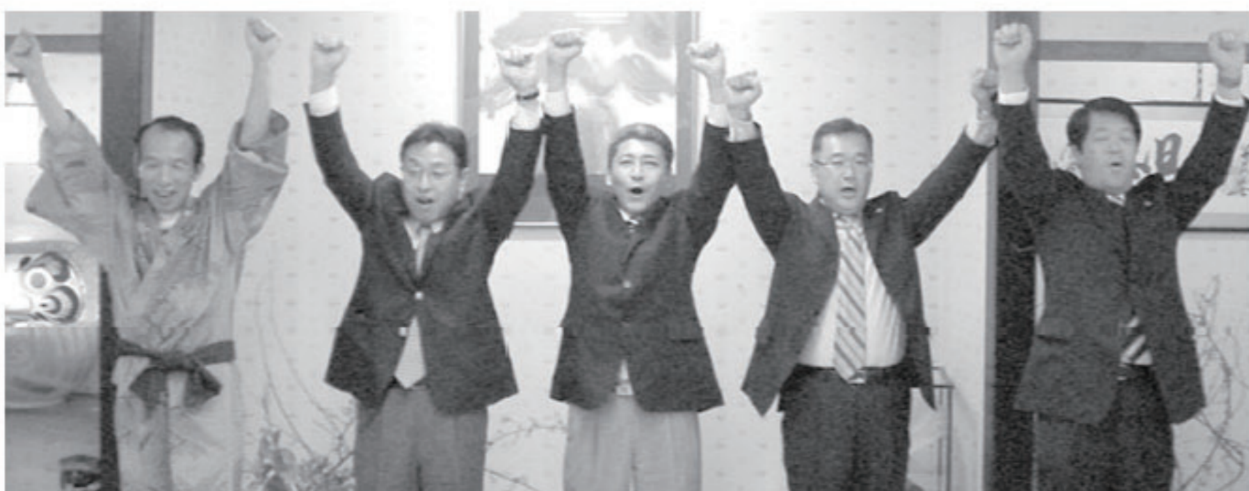
新旧3役によるローアです