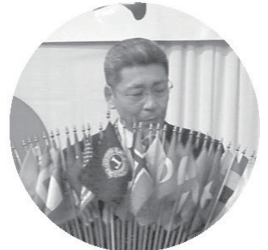
竹村会長閉会のあいさつ