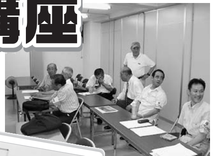
準備中のメンバー

9月8日(土)、15日(土)パレット3Fにおいて行われたデジカメラ講座は8月22日には満席になるといううれしい反応で、当日は熱心に講師を見つめる多くの熱気がありました。