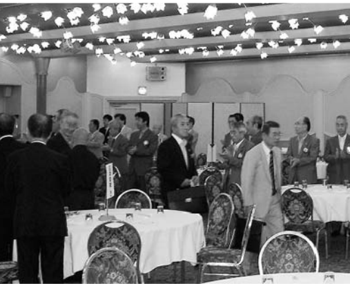
地区ガバナー、地区役員入場