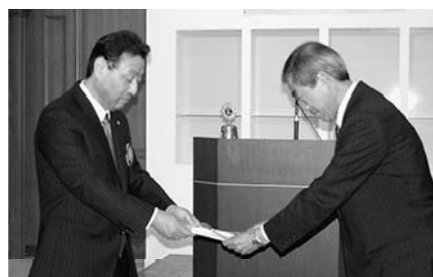
沼津市社会福祉協議会様に贈呈

10月18日(木)、PR情報委員会担当の第2例会が実施されました。沼津市社会福祉協議会へ助成品目録の贈呈が行われました。