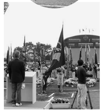
野球少年はいいですね