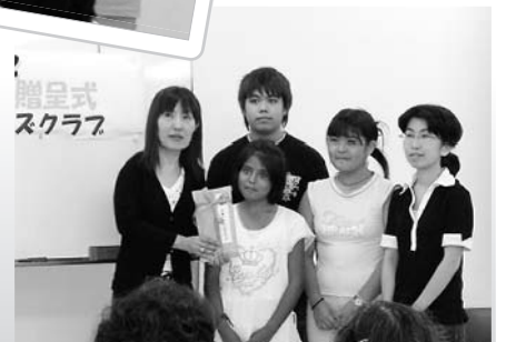
「地球のステージ2」チケット寄付