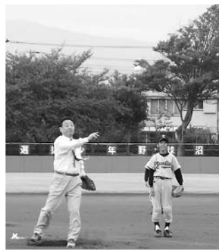
小池会長始球式です