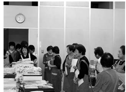
後援は沼津ライオネスクラブの皆様