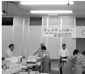
定刻前から準備が始まります

9月30日(日)沼津駅前南口に於いてチャリティバザー、献眼登録が行われた。あいにくの雨天ではあったが、多数の皆様参加を頂き50万円を超える売上げを果たせました。併行して行われた献眼登録受付も15名。実りのあるアクティビティでした。