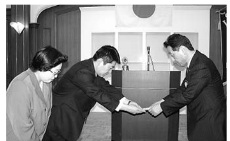
落合ライオンのご家族よりアイバンク運動へ寄付