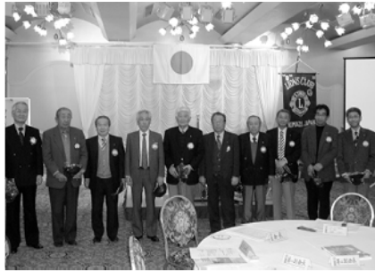
MJF献金者へ感謝の帽子贈呈