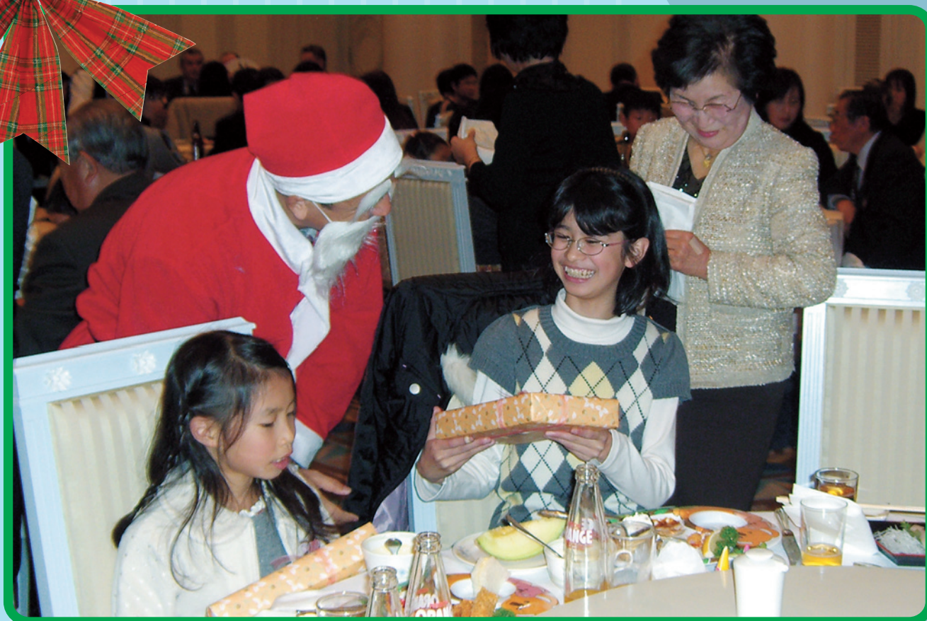
「永遠のクリスマス」