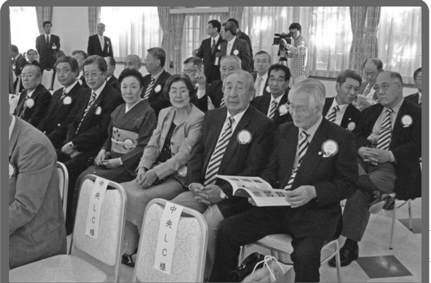
倉敷アイビースクエア・フローラルコートで式典