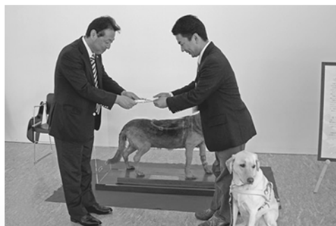
助成金の贈呈を行いました

日本盲導犬総合センターは平成18年10月にオープンした。盲導犬の出産から引退後の生活まで過ごすことができ、より良い盲導犬育成システムを研究していく施設です。この場所は以前オウム真理教富士山総本部の跡地です。