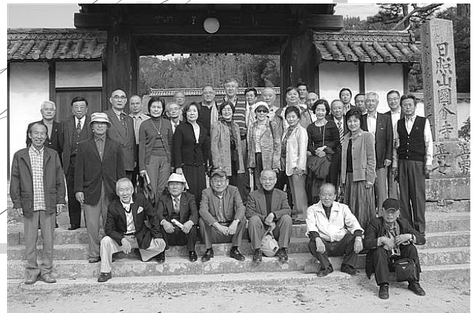
備中国分寺(五重塔)で