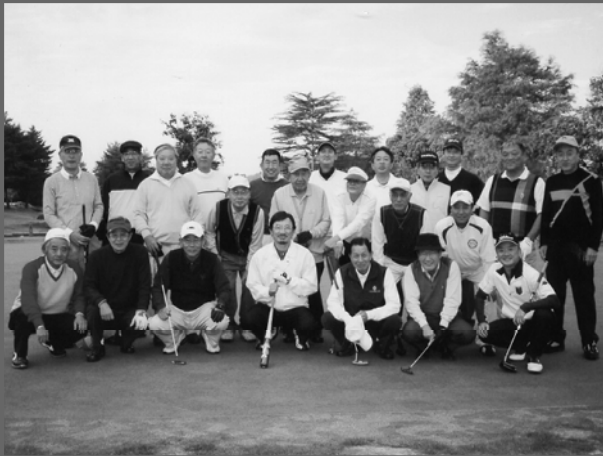
後楽ゴルフ倶楽部で