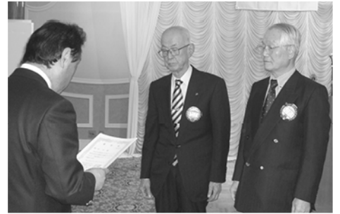
アイバンク協会認定サポーター講習会受講証伝達