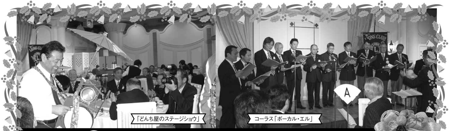
「どんち屋のステージショー」