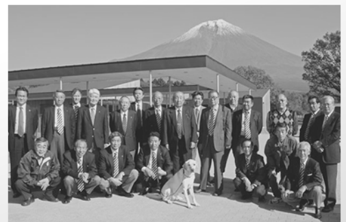
広大なスペースをもった近代的な施設です