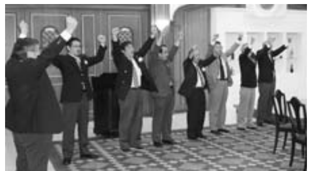
委員長全員によるローア