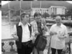
海賊船上にて 夜の海の家賊? 3名