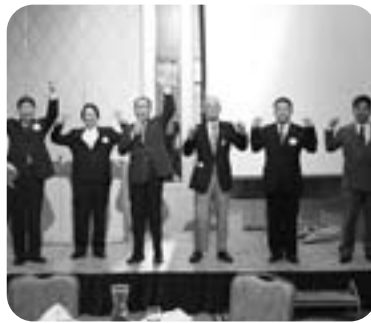
文字通り“新旧”ライオンによるローア