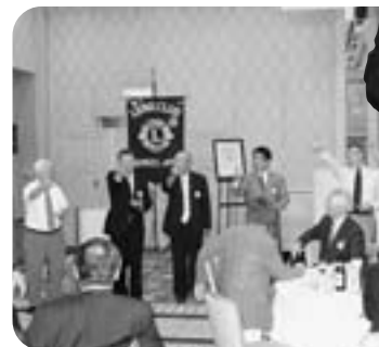
お楽しみ会 楽しそうです