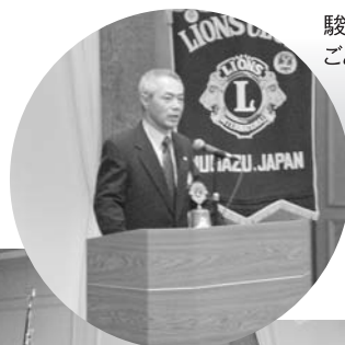
駿河LC L.神戸会長のごあいさつ

12月4日、駿河LCとの合同例会。両LCのテールツイスター・ライオンテマーの趣向をこらした演出で盛り上りました。ご苦労様でした。