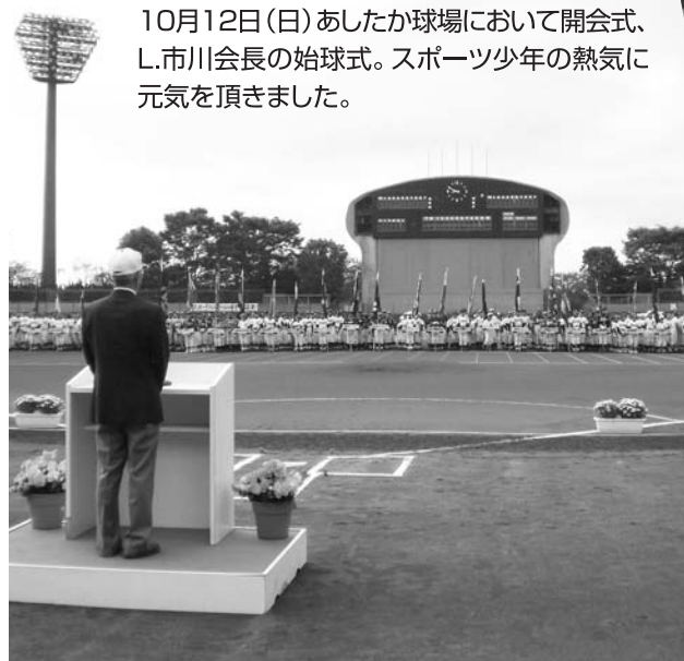
交流大会開会を宣言