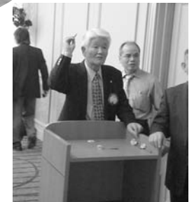
ダーツな表情です