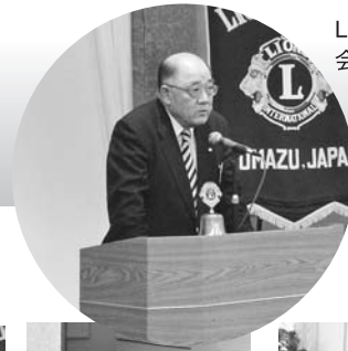
L.市川会長の会長のあいさつ