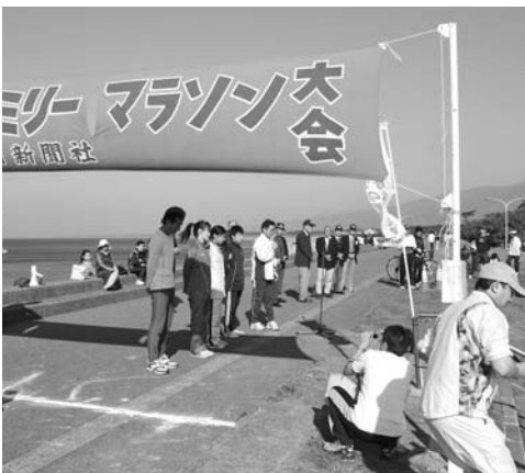
快晴の下、開会式が行なわれました