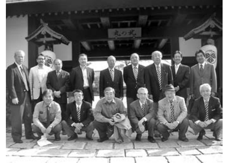
葛城北の丸で昼食です