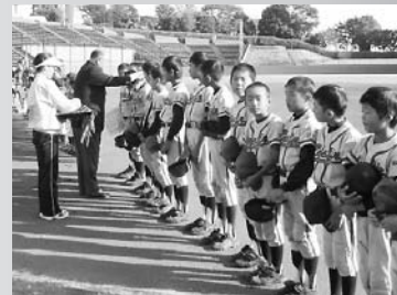
よくやった 感動した