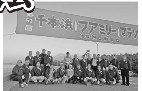
総勢30名が参加しています

10月19日(日)千本浜ファミリーマラソン大会開催。早朝6時30分から清掃開始。30名が参加して、にぎやかに行なわれました。献眼登録受付は5名でした。