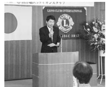
両眼移植体験を語って頂きました