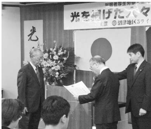
沼津市長より感謝状伝達授与

10月11日沼津市民文化センターにおいて感謝状伝達式が行なわれ、L.勸山の講演、10/2の街頭献眼受付の記事の新聞コピーを配布しました。