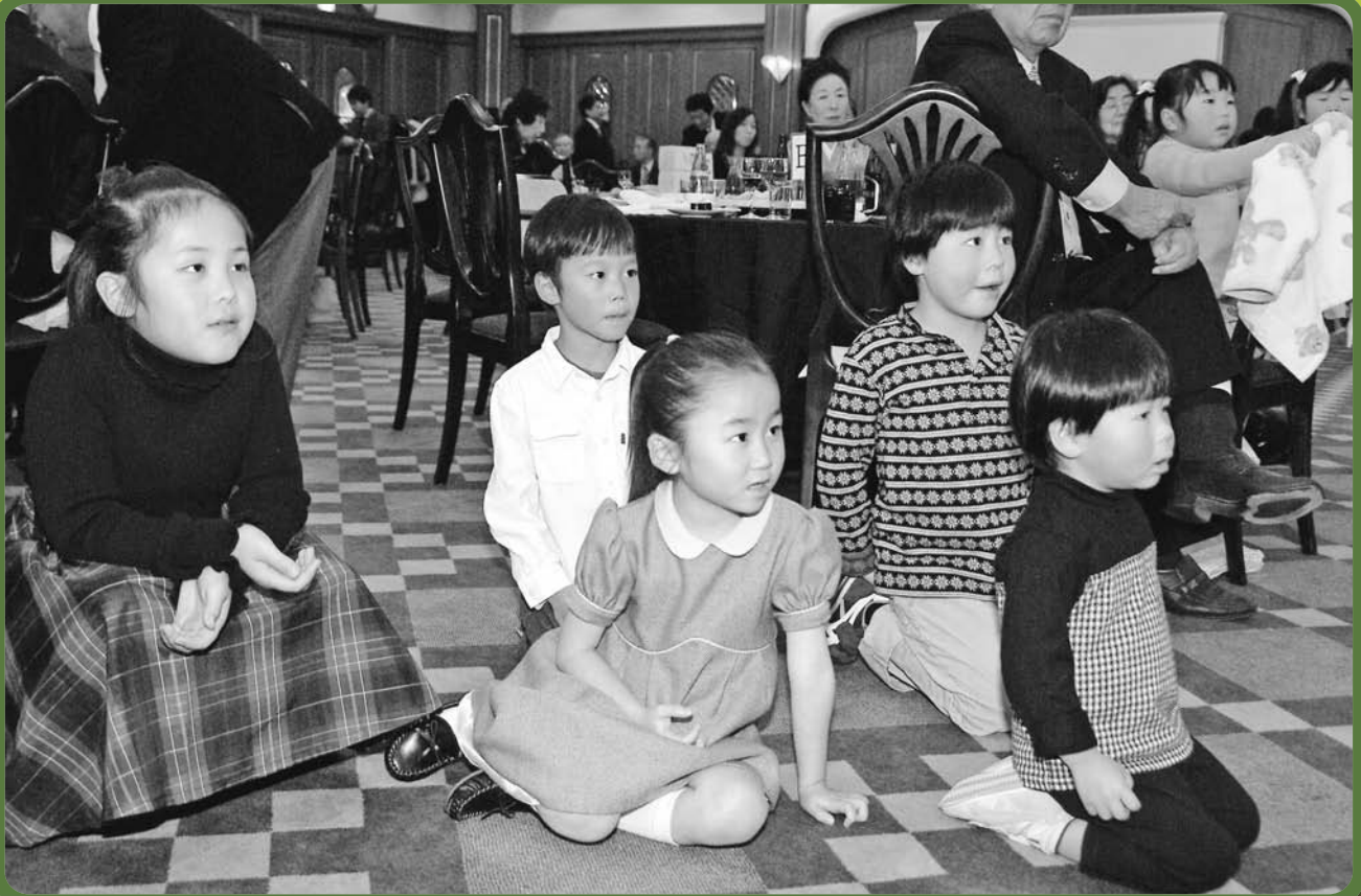
「クリスマス例会にて」