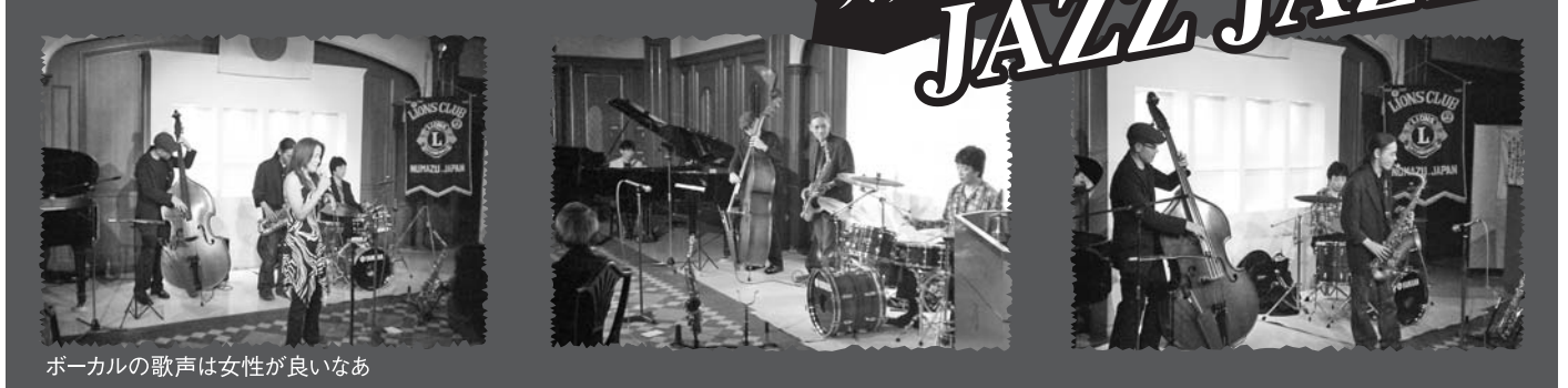
ボーカルの歌声は女性が良いなあ