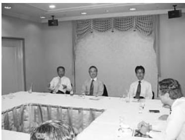
倉敷LC、沼津LCとの意見交流会 力が入ります

10月2日例会後、街頭で“献眼受付運動”を沼津駅前、仲見世商店街の2班に分かれ、午後1時30分より開始。一方、沼津東急ホテルでは倉敷ライオンズクラブとの意見交流会が始まるという、まさに全員参加例会活動でした。この日31件の登録受付を頂きました。皆様ご苦労様でした。