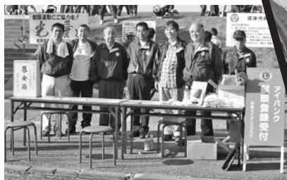
準備万端で登録者を待ちます