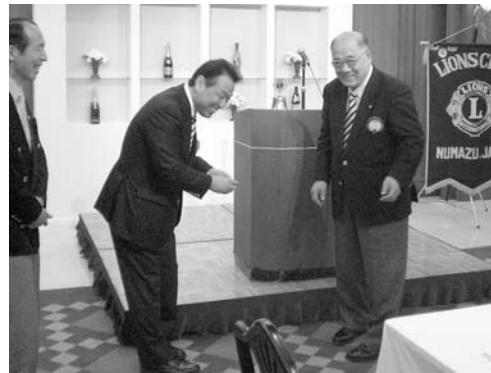
L.市川会長より前会長、前幹事に優秀賞を受賞伝達