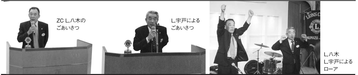
ZC L.八木の ごあいさつ