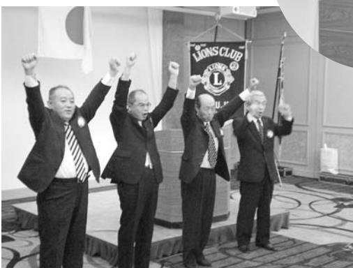
両LCのテールツイスター・ライオンテマーによるローア