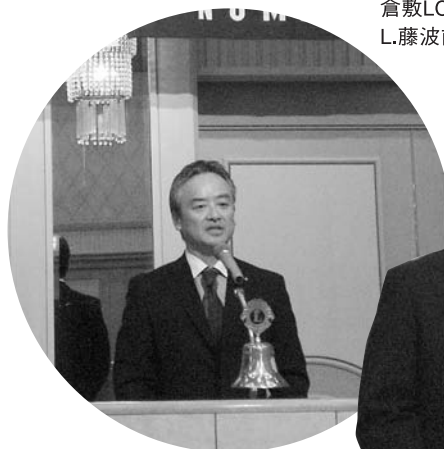
倉敷LC L.藤波前会長よりごあいさつ