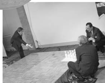
ボウリングは手動式なので ピン並べ係は大変です