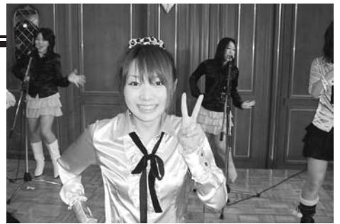
ミュージック「オレンチェ」

12月20日(土)ボーカルエルのコーラスでスタート。 両土屋ライオンのあいさつと乾杯で盛り上がります。 ミュージックアワーは「オレンチェ」。 子供たちは大喜びでした。