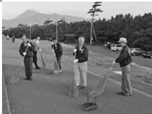
掃除は 手慣れたものです