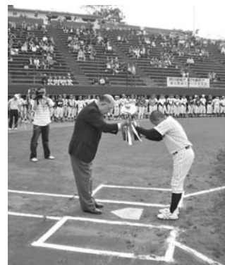
優勝カップの返還