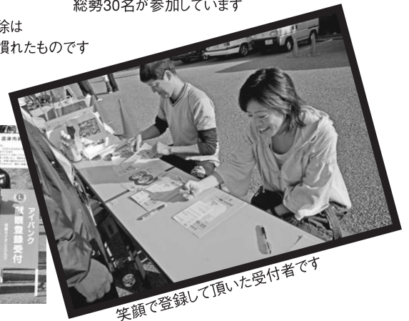
笑顔で登録して頂いた受付者です