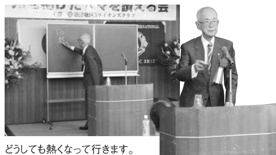
どうしても熱くなって行きます。

10月11日沼津市民文化センターにおいて感謝状伝達式が行なわれ、L.勸山の講演、10/2の街頭献眼受付の記事の新聞コピーを配布しました。