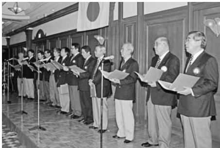
ボーカルエルの歌声