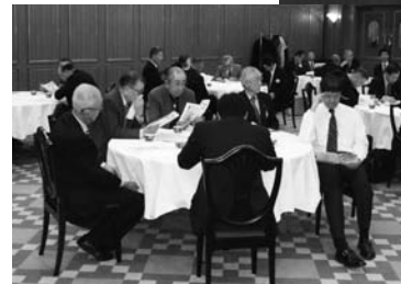
スピーチに聞き入るメンバー