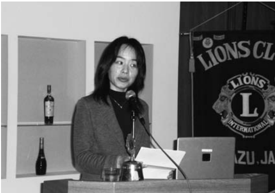
私達ができる事は無駄をしない事