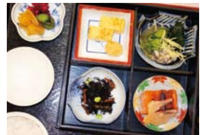
▲今回の例会食は「和食」