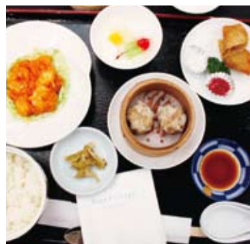
▲今回の例会食「中華」