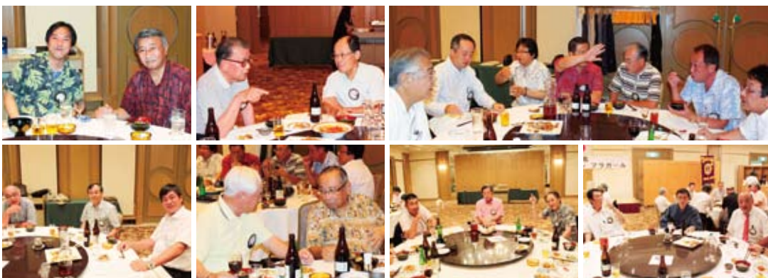
▲なごやかな納涼懇親会