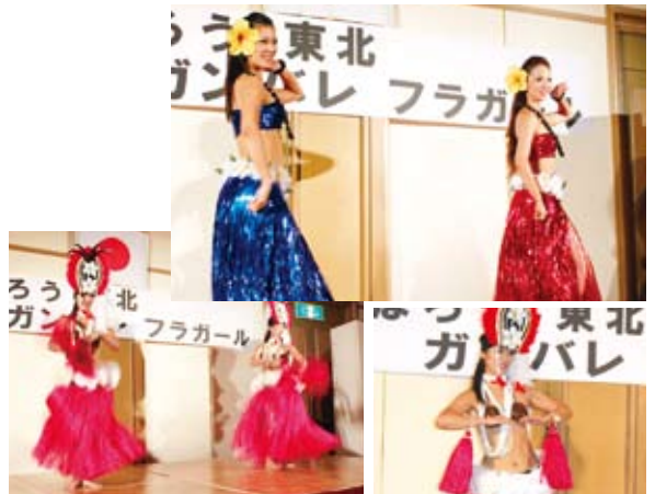
▲本格的なフラダンスの熱演