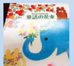
童話集「童話の花束」▶