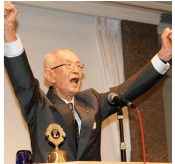
▲L.勸山の力強いローア