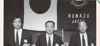
193-4 クラブスローガン

▲1993～94 第35年度会長 北海道南西沖地震に緊急支援の義援金、鹿児島豪雨災害に義援金を贈る。チャリティバザー(プレセール)の収益金を高齢者等福祉世代交流活動施設建設のため沼津市へ寄付。「富士山を世界遺産に」の署名運動を行う。「ぬまづふれあい大バザー」にて献眼登録受付。