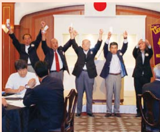
▲前年度例会皆出席の面々