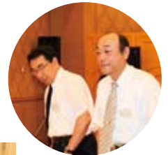
▲2人の見学者も楽しんでくれたようです