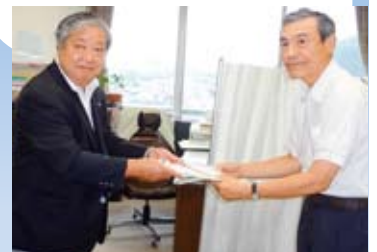
▲会長より教育長へ目録贈呈