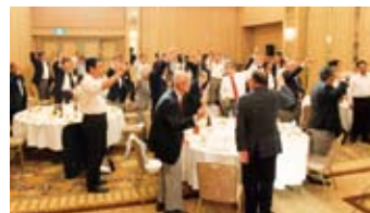
◀クイズ大会も大盛り上がり