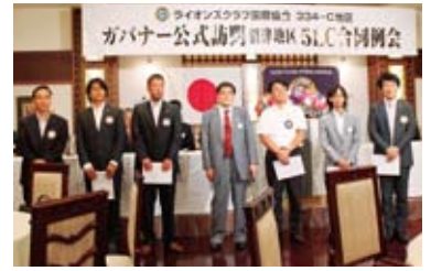
▲5クラブの新会員の紹介