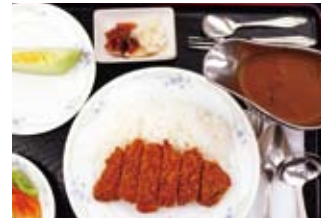
▲今回の例会食「洋食」